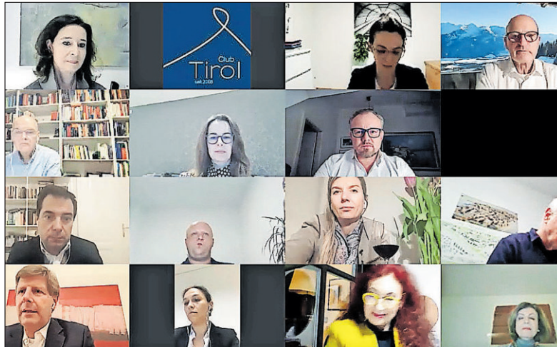
Elftes virtuelles Club Tirol-Meeting via Zoom.